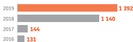
Évolution des pré-ventes en Afrique de l'Ouest (en unités)

Le Groupe compte à ce jour 9 projets dans la région, totalisant 24 467 unités dont deux nouveaux projets lancés à Abidjan, Florida City et Jardins d'Angré pour 7 200 unités.