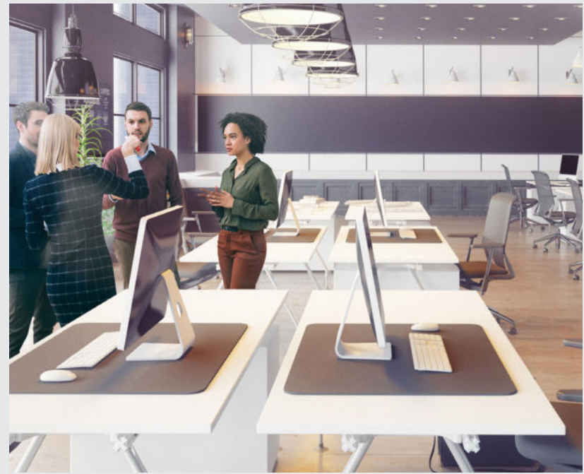
مكاتب للبيع - محلات تجارية

في قلب العاصمة الاقتصادية، مشروع الأزهر يمنحكم أحسن موقع بأحسن ثمن