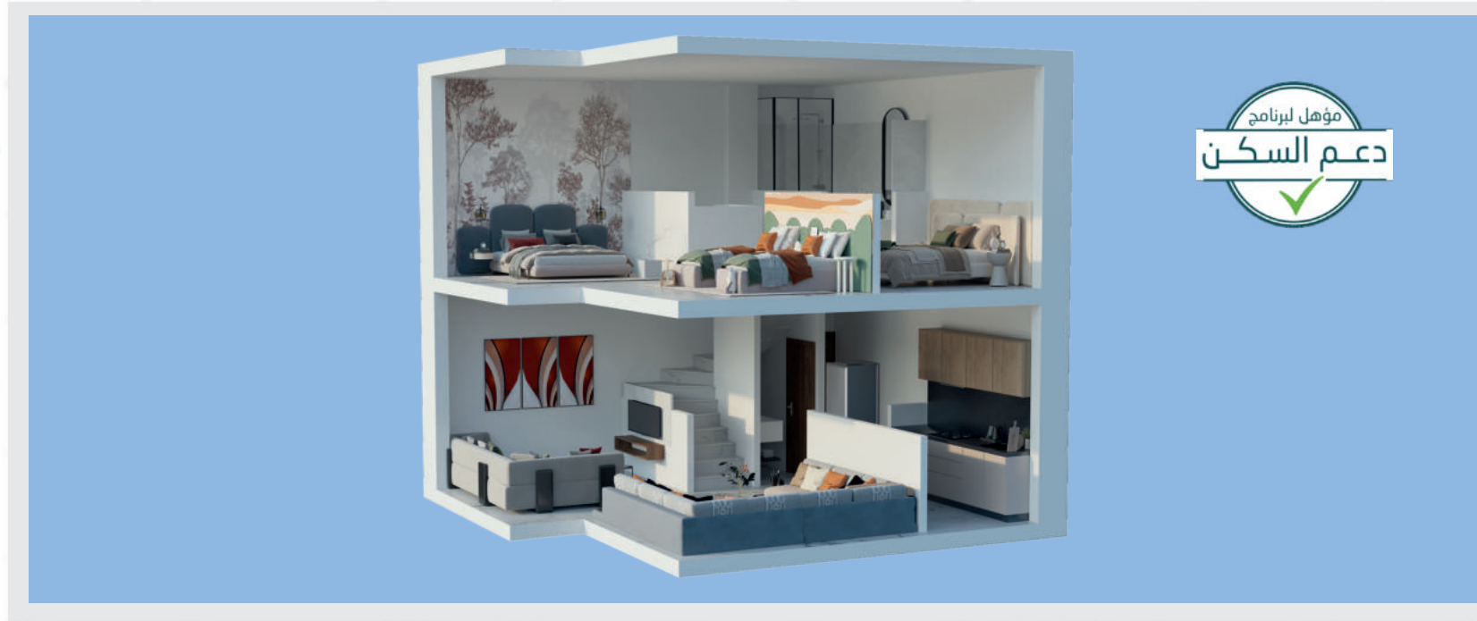
D U P L E X

Le projet AZZOHOUR vous offre l'opportunité d'acquérir un duplex au design moderne.