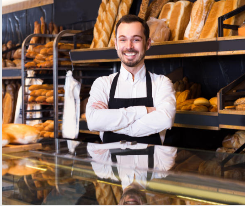
PLATEAUX DE BUREAUX - LOCAUX COMMERCIAUX

Situé au plein cœur de la capitale économique, le projet AL AZHAR vous offre le meilleur emplacement à des prix très bas.