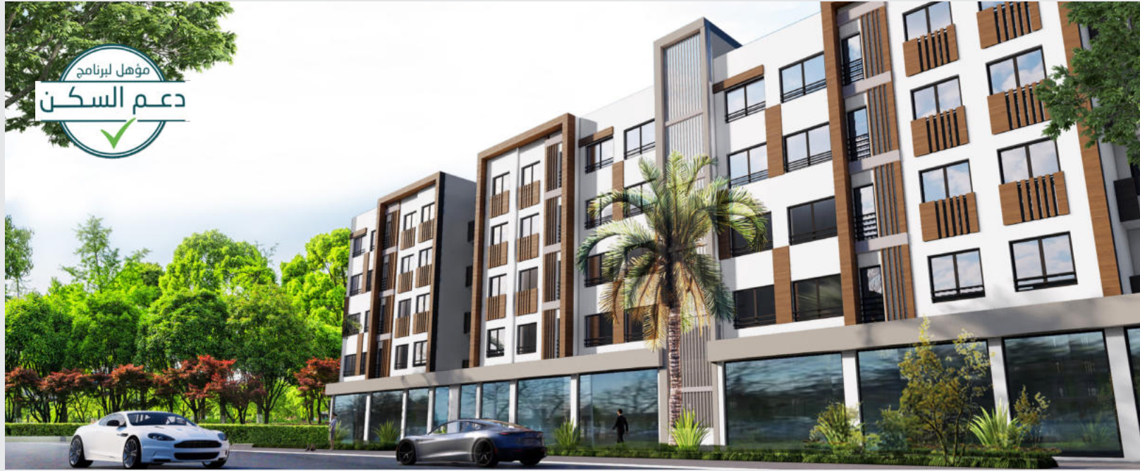
APPARTEMENTS MOYEN STANDING

Situé au cœur de la ville d'ARRAHMA, ce projet se distingue par des appartements de qualité, offrant des finitions de standing moyen, ainsi que les équipements essentiels pour assurer votre confort.