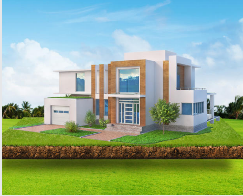
APPARTEMENTS MOYEN STANDING - LOTS DE TERRAIN POUR VILLAS

Situé dans l'un des meilleurs quartiers de la ville ocre, le projet LES PORTES DE MARRAKECH offre une gamme de produits immobiliers exceptionnels pour tous ceux qui désirent devenir propriétaires d'un bien de qualité à Marrakech.