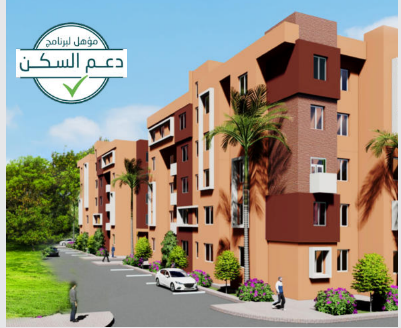
شقق من السكن المتوسط - بضع أرضية لبناء فيلات

من بين أحسن أحياء مراكش، يقدم لكم مشروع أبواب مراكش تشكيلة من المنتجات العقارية الفريدة لكل من يرغب من امتلاك سكن عالي الجودة بالمدينة الحمراء. تتميز شقق مشروع أبواب مراكش بتصميمها الهندسية المتقنة.