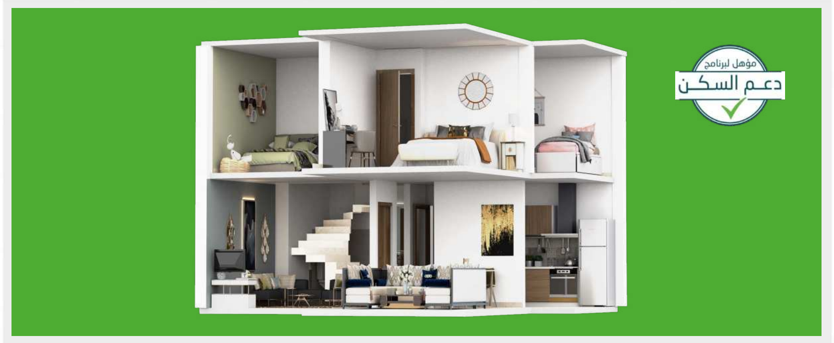
D U P L E X

Des Duplex à quelques minutes de Rabat, c'est seulement chez Groupe Addoha et c'est à ville Al Firdaous