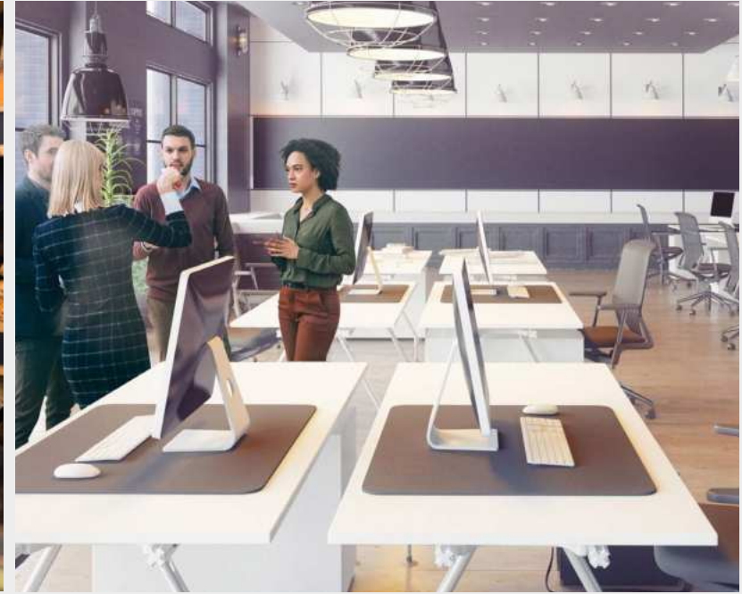
مكاتب للبيع - محلات تجارية

في قلب العاصمة الاقتصادية، مشروع الأزهر يمنحكم أحسن موقع بأحسن ثمن